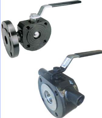
fig 182.1 : staal 3-weg uitvoering fig 182.3 : RVS 3-weg uitvoering fig 181.1H : staal met verwarmingsmantel fig 181.3H : RVS met verwarmingsmantel

RVS 316 volle doorlaat PN16/40 fig 181.3 / fig 181E.3 : DN15-DN200 fire-safe en DVGW-gas op aanvraag RVS 316 kogel / PTFE dichtingen temp. : -20°C/+180°C voorzien van iso 5211 top-boringen